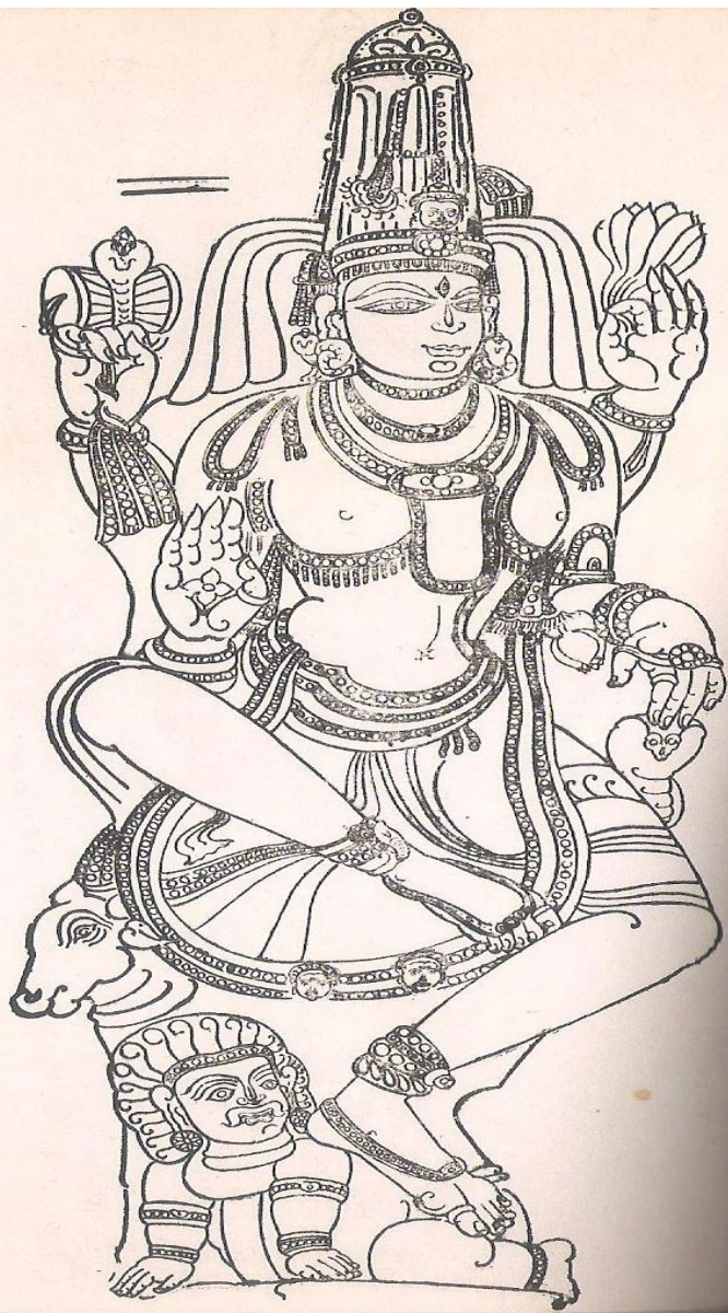
జగతః పితర సంకరే