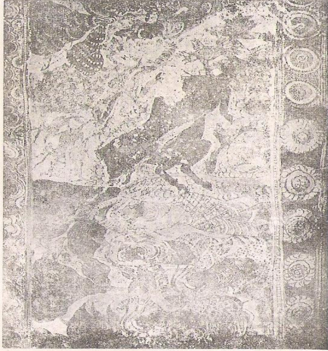
తి రో త్తా రు కీ య ము