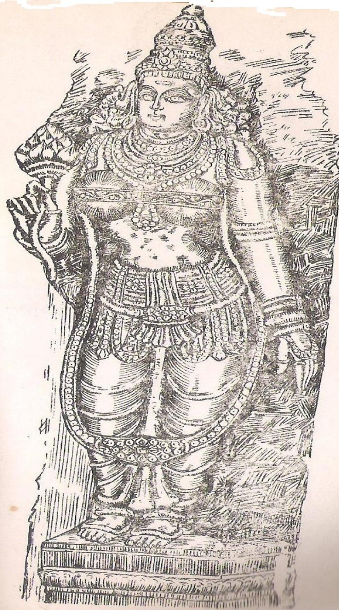
పార్వతీ పరమేశ్వర. లోహిణి శిల్పము