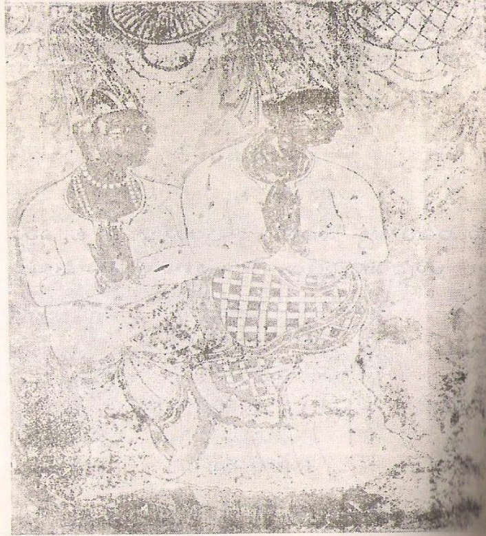
శ్రీ విరణ్ణ విరుపణ్ణలు లేపాక్షి వర్ణచిత్రము